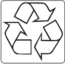
نماد بین‌المللی باز یافت